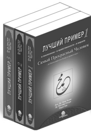
Лучший Пример - 1, 2, 3