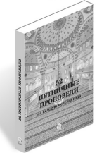
52 Пятничные Проповеди