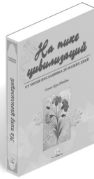
На пике цивилизации